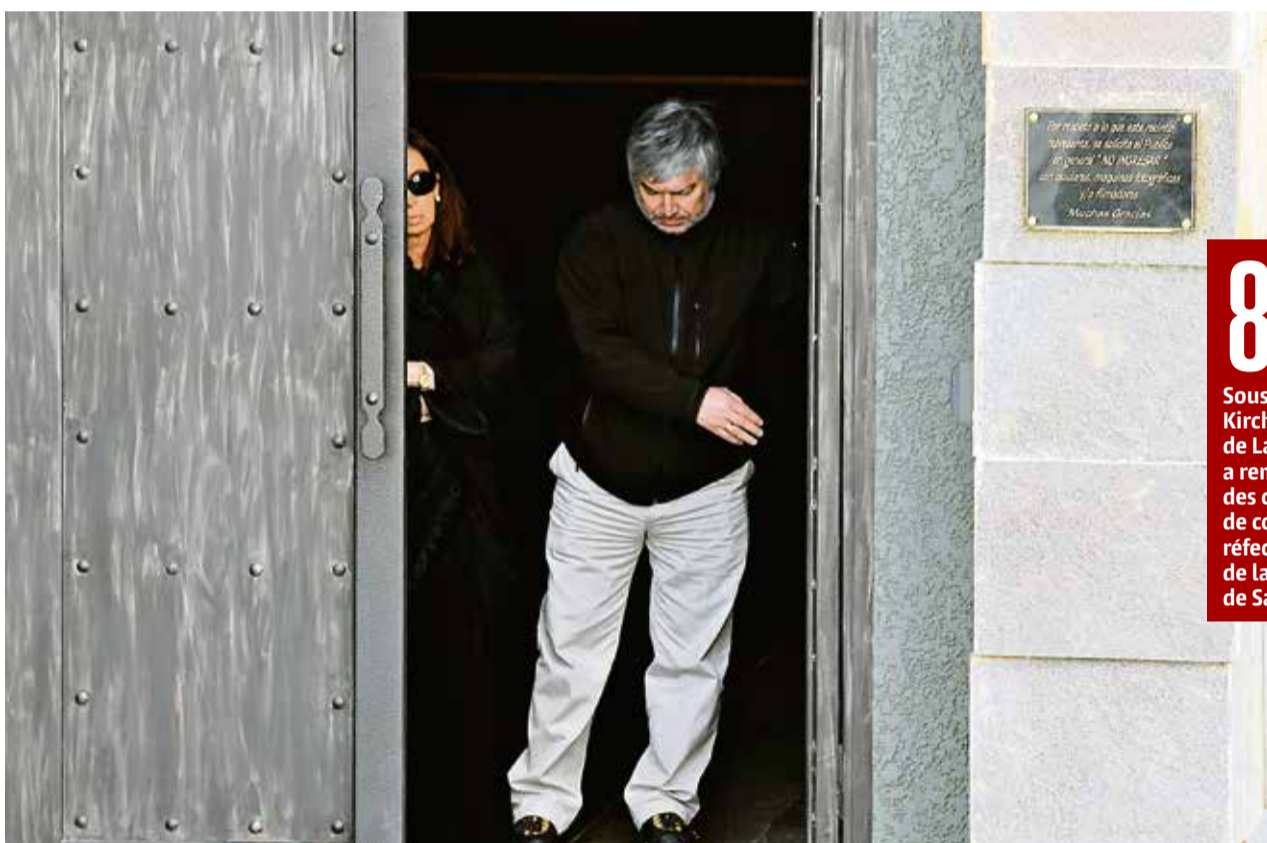
Lázaro Báez était très proche du couple Kirchner. Le millionnaire argentin a fait construire un mausolée de trois étages à Rio Gallegos en l'honneur de Néstor, décédé en 2013.

C'est que la «piste de l'argent K» est longue et tortueuse. Lázaro Báez est soupçonné d'avoir organisé l'évasion, au détriment de l'Etat argentin, de 55 millions d'euros (environ 60 millions de francs) dans un jet privé jusqu'en Uruguay, puis d'avoir transféré une partie de cette somme – via des sociétés offshore caribéennes – sur des comptes genevois de